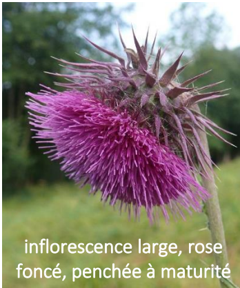
inflorescence large, rose foncé, penchée à maturité