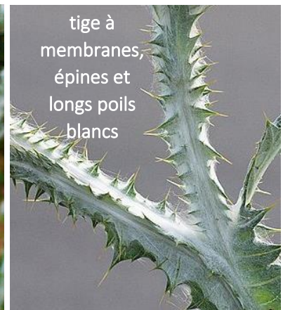
tige à membranes, épines et longs poils blancs