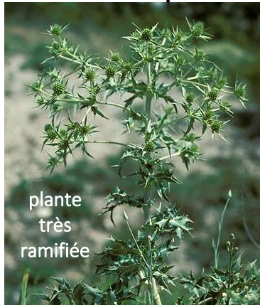
plante très ramifiée