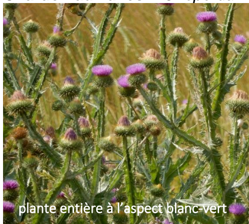
plante entière à l'aspect blanc-vert