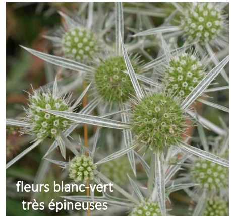
fleurs blanc-vert très épineuses