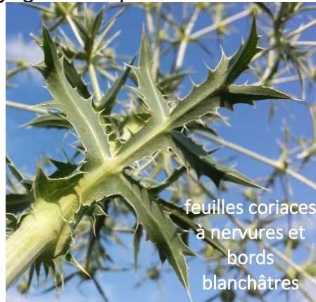
feuilles coriaces à nervures et bords blanchâtres