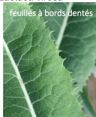
feuilles à bords dentés