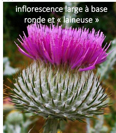
inflorescence large à base ronde et « laineuse »