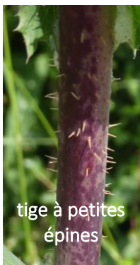
tige à petites épines